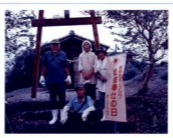
小林市戸崎馬場老人クラブ