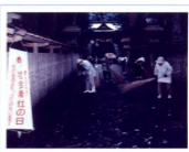
高千穂町上寺きんぎん会