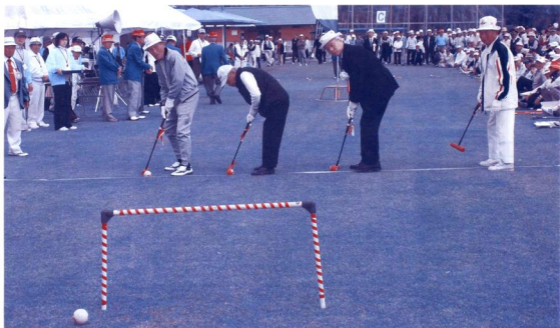
第10回さんさんクラブ宮崎スポーツ大会（ゲートボールの始球式）