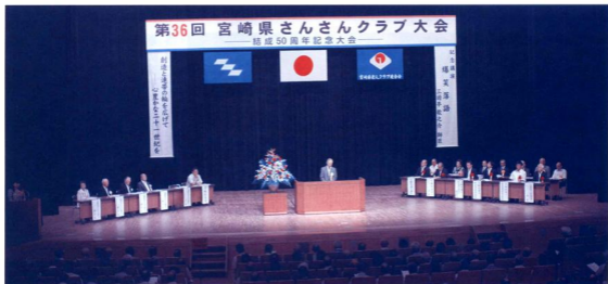
第36回宮崎県さんさんクラブ大会（結成50周年記念大会）開会式