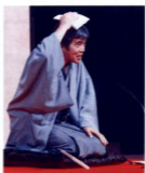
記念講演 三遊亭歌之介師匠の爆笑落語

第二部では、落語家の三遊亭歌之介師匠をお招きし、「爆笑落語」の演目で記念講演を行い、