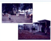
木城町若鶴老人クラブ