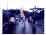
綾町揚町高齢者クラブ