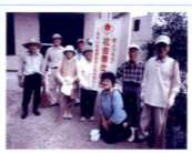
宮崎山下北方南豊寿会