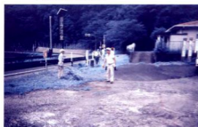
葛葉生活改善センターの清掃風景

人口53名の内25名がクラブ会員ですから、50%近くが老人クラブ会員ということになります。また、家庭を持ちながら老人クラブの会員であるいわゆる「家持会員」でもあります。活動は、月一回の集會に合わせて神社、公民館等の清掃等でありきたりの活動である。それでも、何とか、クラブの活性化を図りたいところだが、前途のとおり若者の不足により超高齢化となり、先行き厳しい現状である。