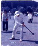
グラウンドゴルフ