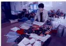
元気袋・支援物資の発送準備 (都城市老連事務局)

全国老人クラブ連合会の呼びかけで、東日本大震災の被災者に対して救援拠金と元気袋を送る運動が全国の老人クラブで展開されました。 宮崎県でも、救援拠金が89万6千円、手作りの元気袋2、219袋、励ましのメッセージカード1,150枚、支援物資が段ボールで320箱寄せられました。九州の老人クラブは、岩手県を支援することになり、過日、メッセージカードを添えて元気袋と支援物資を市町村の各老連事務局から直接岩手に送っています。