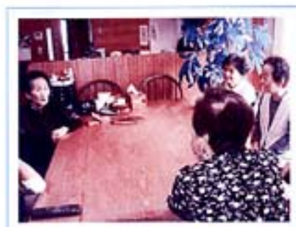
綾町友愛訪問活動でシルバーボラ ンティアが訪問している様子です。