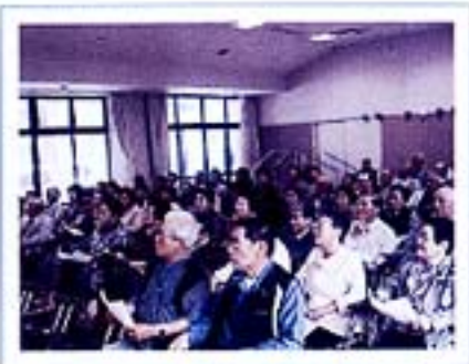
五ヶ瀬町高齢者福祉大会