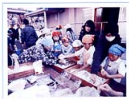
三股町宮村地区高齢者クラブ 小学校との交流会