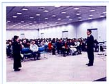
宮崎市女性全体研修会 高齢者にとっての津波避難とは