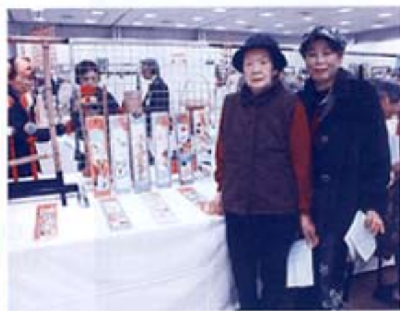
オープニング/テープカット