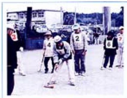
小林老人クラブ連合会 ゲートボール県大会予選