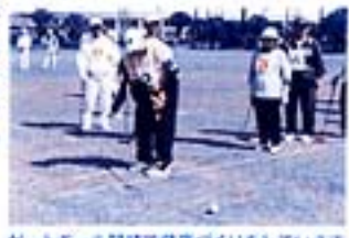
ゲートボール競技で健康づくりをしています

な活動としています。また、単位老人クラブに対する連絡調整機関としての役割を果たす組織として、同老人クラブの発展向上について積極的に取り組んでいます。昨年8月、椎葉村地域振興課により「椎葉村各種団体アンケート調査」が実施され、当老人クラブ連合会及び単位老人クラブも調査に協力しました。