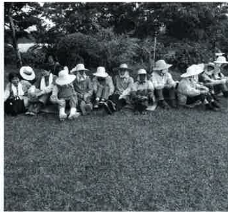
▲花植えのあとの休憩中

結んだことを会員一同、誇りに思っています。今後も上野高齢者クラブは、「(老)後を楽しく 夢見るクラブ」をモットーにみんなで力をあわせて活動していきたいと思えます。