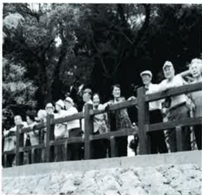
▲鹿児島県南洲墓地にて米良と西郷隆盛の関係について学ぶ