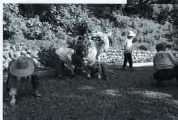
▲大年神社の清掃を終えて

役員及び評議員の陣容が揃う 健康ウォーキングモデル地区を指定 旅館・ホテル等指定一覧