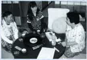
▲「加勢の日」での訪問風景