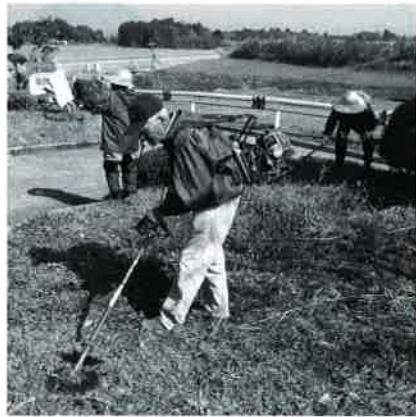
▲銚立公演の草刈り