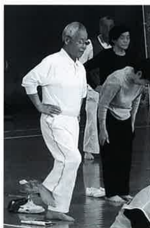
◀日南市:開眼片足立ち測定

また、この健康ウォーキングは誰でも参加できることから隣の人にも声をかけやすく、今回は、会員外の参加者があつたことも特徴的となりました。その意味で、「100万人増強運動」の一助となるのが期待されるものとなりました。