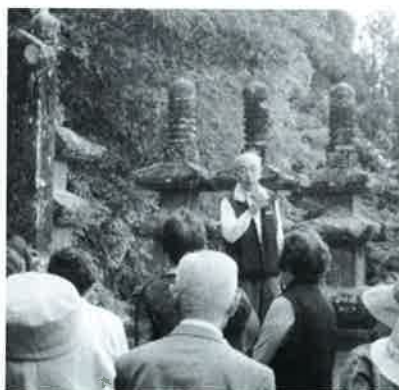
▲日南市五百撰神社にて地元ボランティアの方によるお話し

山にまつわる歴史や伝承を訪ねます。この事業が西米良村老人クラブ連合会同様末永く続いてほしいと切に願うところです。